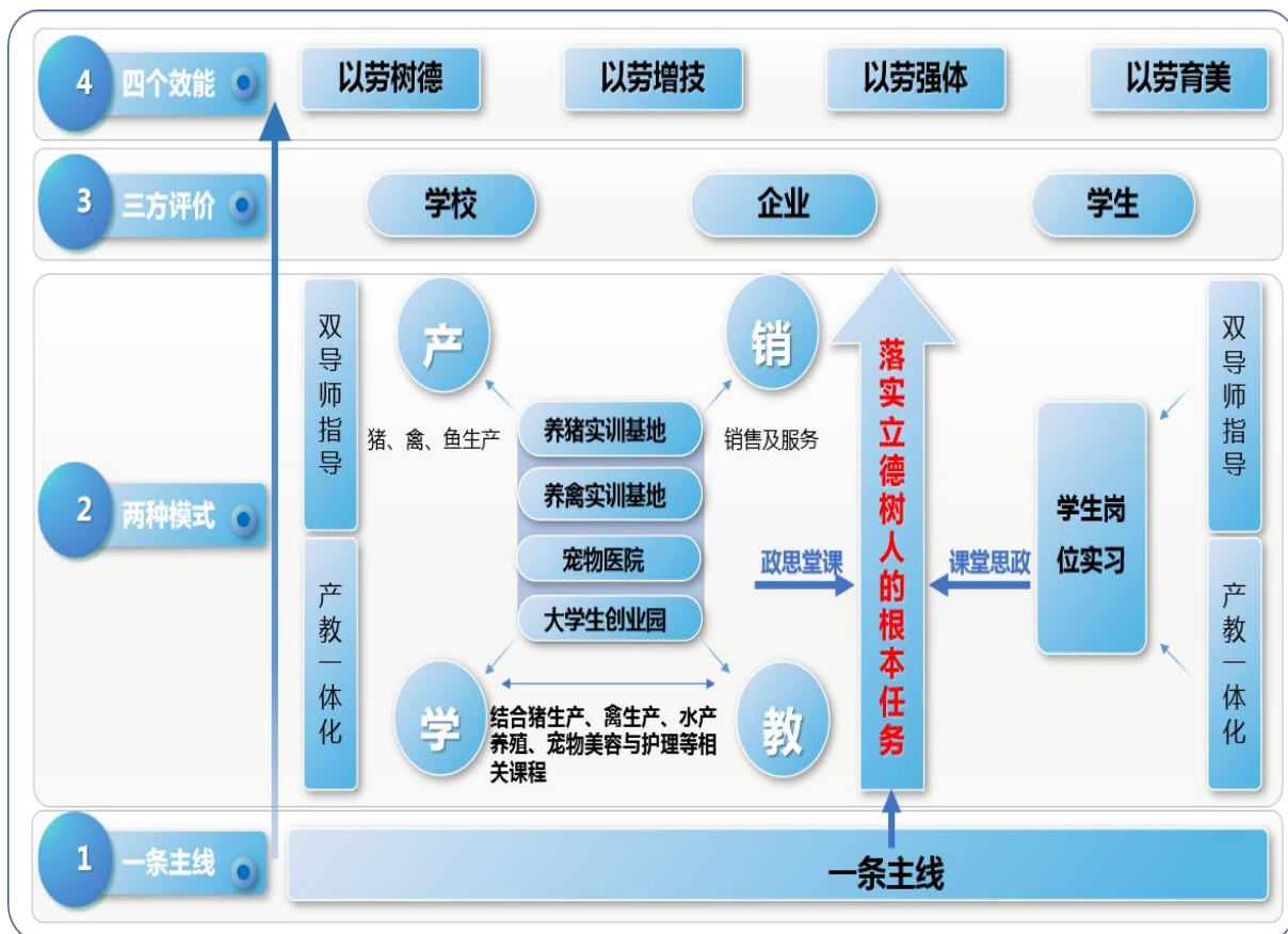
图2 畜牧兽医专业群“1234”一体化课堂革命模式图

“一条主线”：坚持以党建引领、落实立德树人的根本任务为主线，把社会主义核心价值观体系融入职业教育全过程，实施课堂思政。