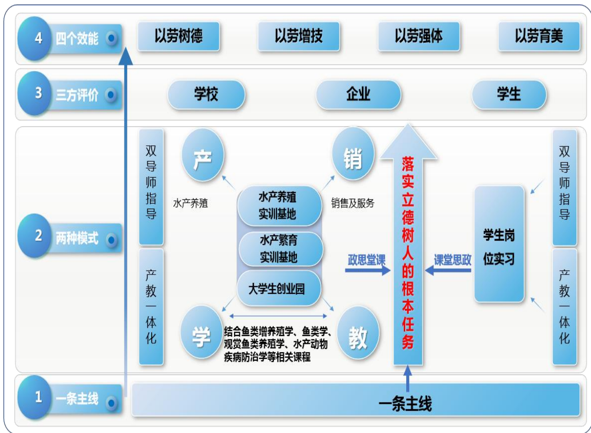
图2 水产养殖技术专业群“1234”一体化课堂革命模式图

“一条主线”：坚持以党建引领、落实立德树人的根本任务为主线，把社会主义核心价值观体系融入职业教育全过程，实施课堂思政。